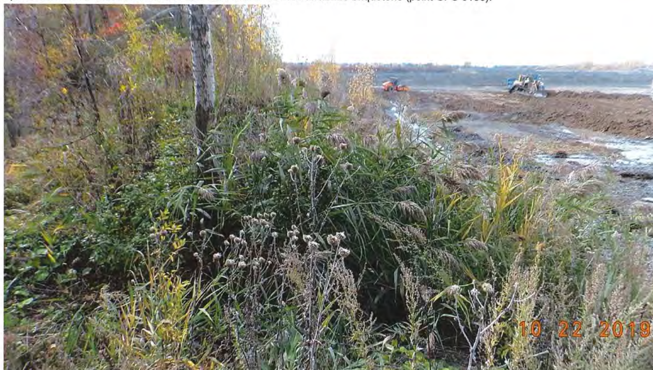
Photo du ponceau alimentant le fossé dans le coin nord-est du site de l'ancienne briqueterie (point GPS 0136).